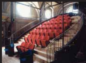
Domenico Bagliani per la Chiesa della Confraternita di Santa Croce, piazza Alfieri a Beinasco.